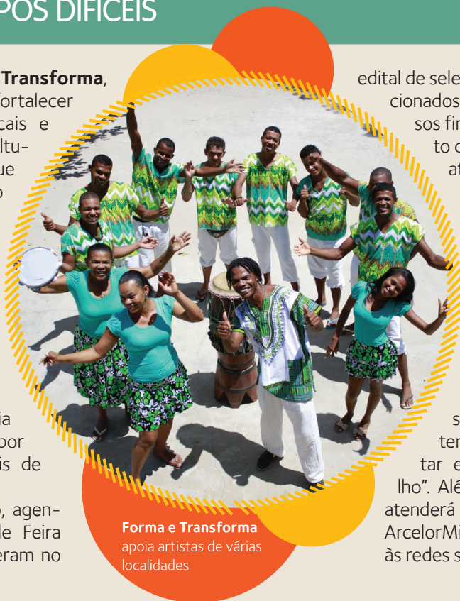
Forma e Transforma apoia artistas de várias localidades

Durante o mês de junho, agentes e coletivos culturais de Feira de Santana (BA) se inscreveram no